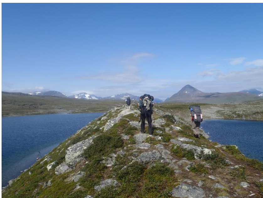
Perinteinen kesävaellus tehtiin Parakselle ja Pältsatuntureille